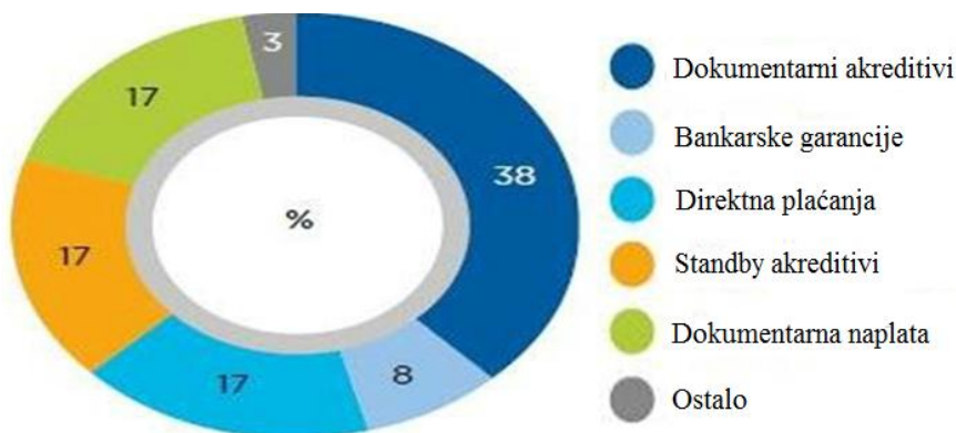
Slika 2. Procenat učešća bankarskih garancija i stand-by akreditiva kao instrumenata za podsticanje izvoza u 2015. godini